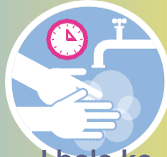
I bolo ko